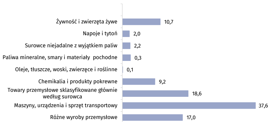
Wykres 2. Struktura importu według sekcji nomenklatury SITC w okresie I - IX 2019 r.